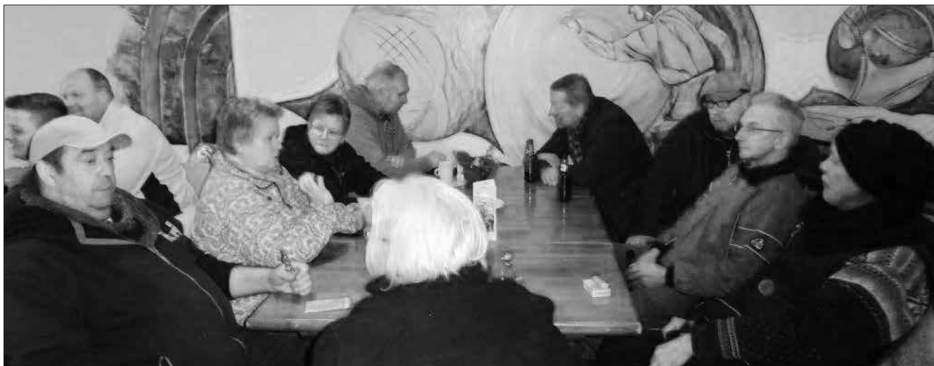
Duitse boulers tijdens het IndoorTripletten 2016