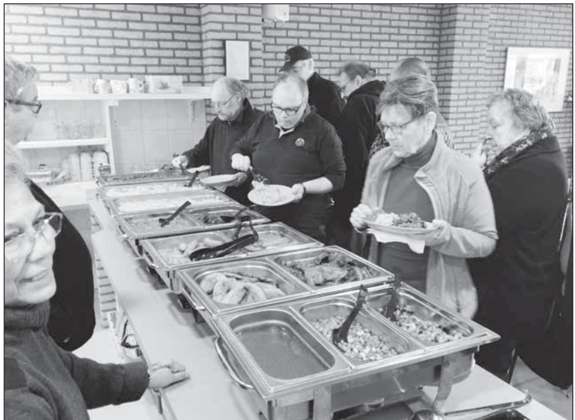
Foto's stampottoernooi, 28 februari 2016